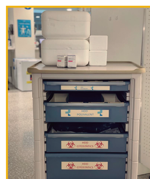
Trasporte y recepción en la unidad